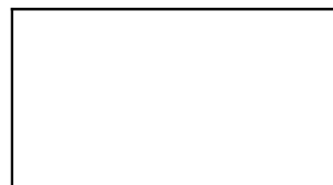
czytelny podpis reprezentanta